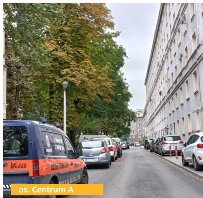
os. Centrum A

niezauważalne dla osób niezamieszkujących danego obszaru, jednak dla najbliższych mieszkańców niezwykle ważne i często diametralnie zmieniające ich codzienność. To właśnie w tych sytuacjach wyraźnie pokazuje się rola radnego miejsca – jako osoby, która zna i wskazuje potrzeby mieszkańców. W tegorocznym budżecie Rady Dzielnicy XVIII znalazły się m.in.: remont chodnika os. Górali 9, remont chodnika os. Wandy 29 - 30, remont chodnika os. Centrum C 10, naprawa chodnika i jezdni przy ul. Św. Wincentego - os. Pleszów, remont chodnika os. Willowe, remont chodnika os. Sportowe, remont chodnika os. Teatralne, remont nakładki jezdni i chodnika przed sklepem „Biedronka” - os. Kolorowe, remont nakładki i jezdni os. Centrum A, remont nakładki, jezdni i krawężnika os. Spółdzielcze, remont chodnika os. Szklane Domy, remont chodnika os. Na Skarpie, remont nakładki asfaltowej ul. Pod Gajem, naprawa nawierzchni jezdni ul. Powiatowa, naprawa nawierzchni jezdni ul. Flame, naprawa nawierzchni jezdni ul. Gręby. Na zdjęciach prezentujemy wybrane inwestycje.