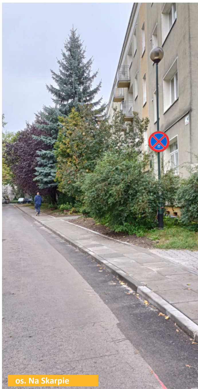
os. Na Skarpie

Radni Dzielnicy XVIII każdego roku podejmują szereg ważnych i niezwykle trudnych decyzji. Wśród nich są te dotyczące remontów i inwestycji. Mając ograniczone środki, muszą oni wybrać miejsca, które zostaną odnowione. Stworzona i ujęta w budżecie lista zadań jest realizowana w ciągu roku kalendarzowego. Chociaż zakres realizowanych przez Dzielnicę zadań jest ogromny, a obszary, nad którymi pochylają się radni, są zróżnicowane, od lat najwięcej emocji i interwencji dotyczy tego, co nas bezpośrednio otacza – czyli chodników, parkingów i stanów nawierzchni ulic. Nic zatem dziwnego, że w corocznym budżecie Rady Dzielnicy na zadania z tych obszarów przeznaczona jest niemal 30%. Przykładowo, w 2025 roku budżet Rady Dzielnicy XVIII Nowa Huta wyniósł około 6,5 miliona złotych, a na zadania: „remonty dróg, chodników, miejsc parkingowych i oświetlenia” oraz „budowa, modernizacja, remont chodników i skwerów wewnątrz osiedli” wydano łącznie nieco ponad 2 miliony. Warto podkreślić, że kwota ta jest nieadekwatna do potrzeb i mając świadomość, że nie uda się zrealizować wszystkich oczekiwań mieszkańców, radni starają się tak lokować środki, by w miarę możliwości w każdym okręgu zrealizować jakąś inwestycję. Są to często, z pozoru, drobne zmiany, czasem wręcz